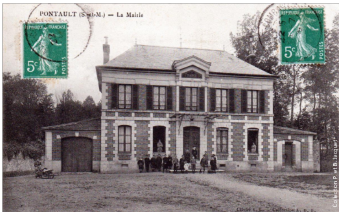
Figure 1 : Mairie de Pontault-Combault – carte postale oblitérée en juin 1909

Les éléments entre crochets renvoient aux références correspondantes en fin d'article.