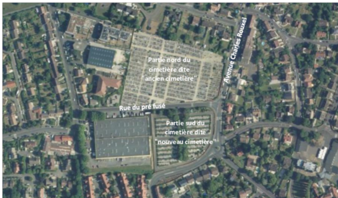
Figure 1 : Le cimetière du pré fusé à Pontault-Combault

Lien vers le plan de l'ancien cimetière : https://cimetiere.gescime.com/PlansCimetieres/pontault-combault-cimetiere-77340