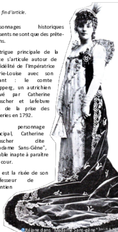
[2] Réjane dans "Madame Sans-gêne" [2]

Elle est la risée de son professeur de maintien et