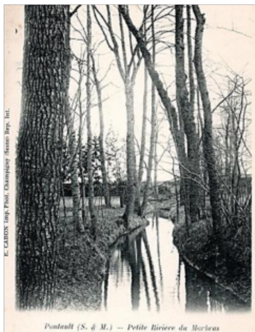
Figure 1 : Carte postale ancienne du Morbras

Le Morbras traverse notre commune d'est en ouest au niveau du Vieux Pontault. L'origine de son nom est de toute évidence relative au fait qu'avant de se jeter dans la Marne ce ru en est le « bras mort ». Sur une carte de Cassini de 1736, ce ru est d'ailleurs dénommé Mortbras.