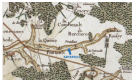
Figure 2 : Carte de Cassini issue de l'exemplaire dit de « Marie-Antoinette » du XVIII e siècle montrant le Morbras et ses affluents

Deux autres affluents rejoignent le ru du Morbras en aval du territoire de Pontault-Combault. L'un, le ruisseau des Nageoires prend sa source dans le bois Notre-Dame à Noiseau, le second le ru de la Fontaine de Villiers prend également sa source dans le bois Notre-Dame à Sucy-en-Brie (Fig. 2).